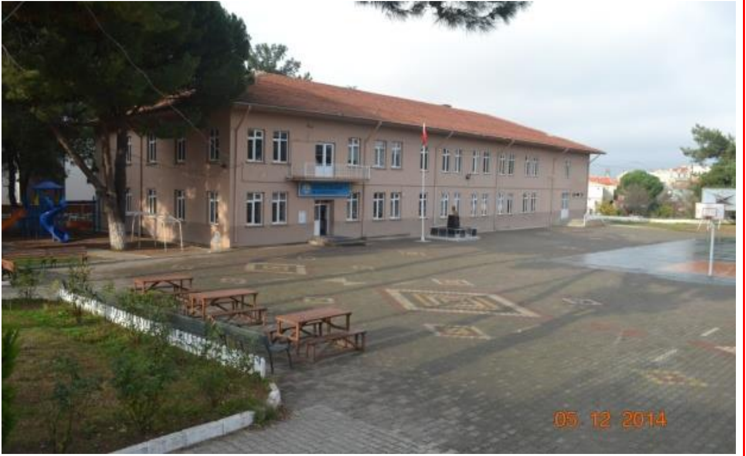
Okul Binasının 05/12/2014 Tarihli Görüntüsü