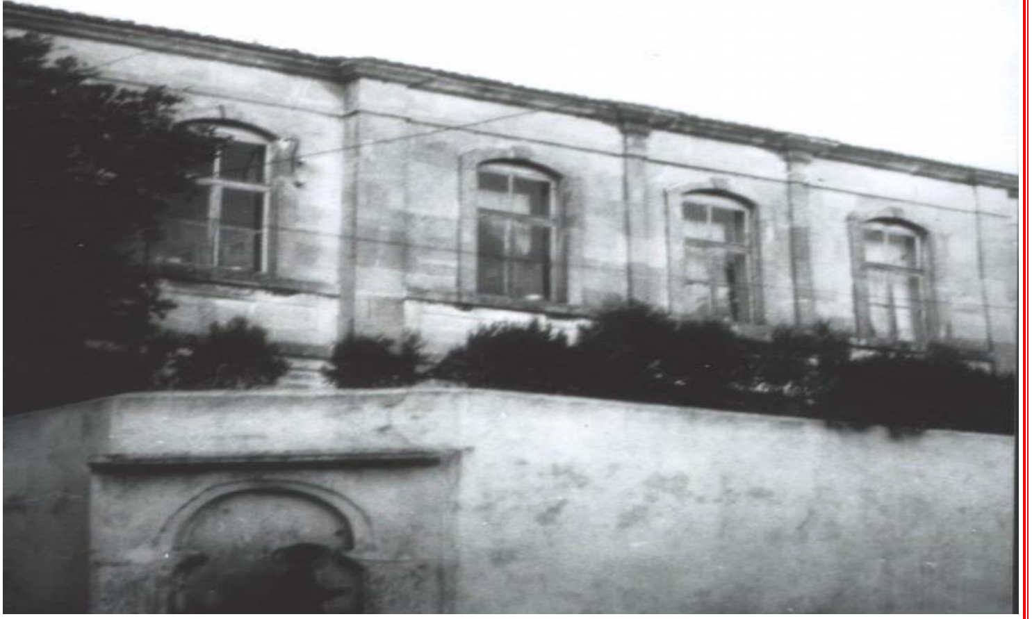
Müsannif Sokaktaki Eski Okul Binası