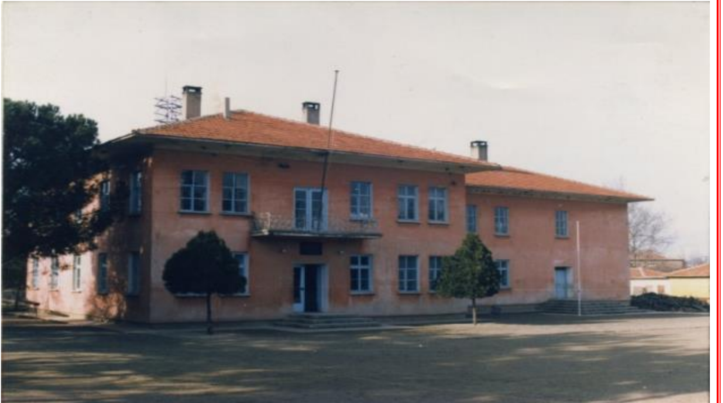
1956 Yılında Yapılan Okul Binasının İlk Hali