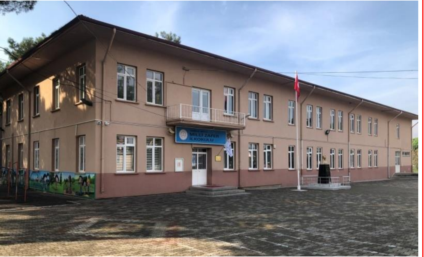
Okul Binasının 30/12/2019 Tarihli Görüntüsü